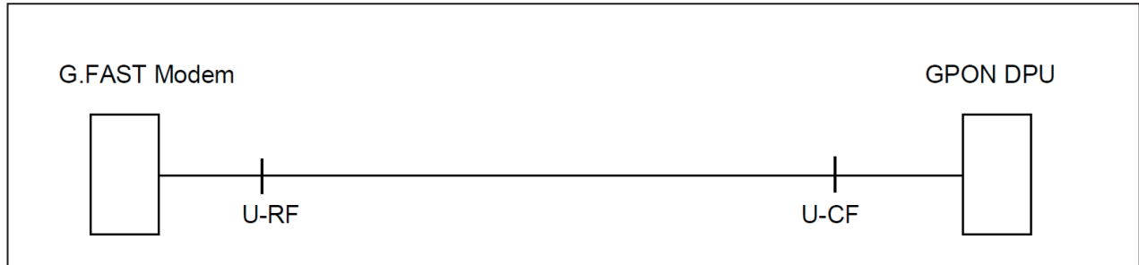
Abbildung: Schematische Darstellung eines G.FAST FTTB Anschluss