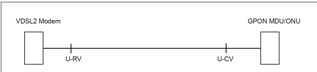
Abbildung: Schematische Darstellung eines VDSL2 FTTB Anschluss